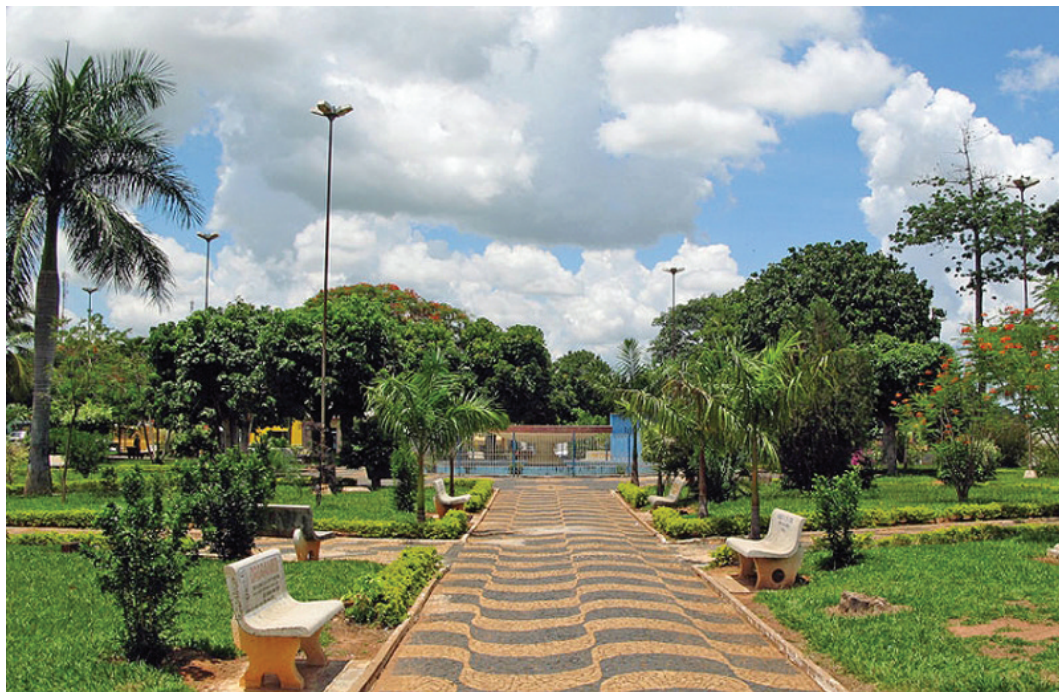
Vista de Herculândia; cidade intensifica as ações de desinfecção das vias com maior fluxo de populares

“Esta semana optamos pela desinfecção das ruas