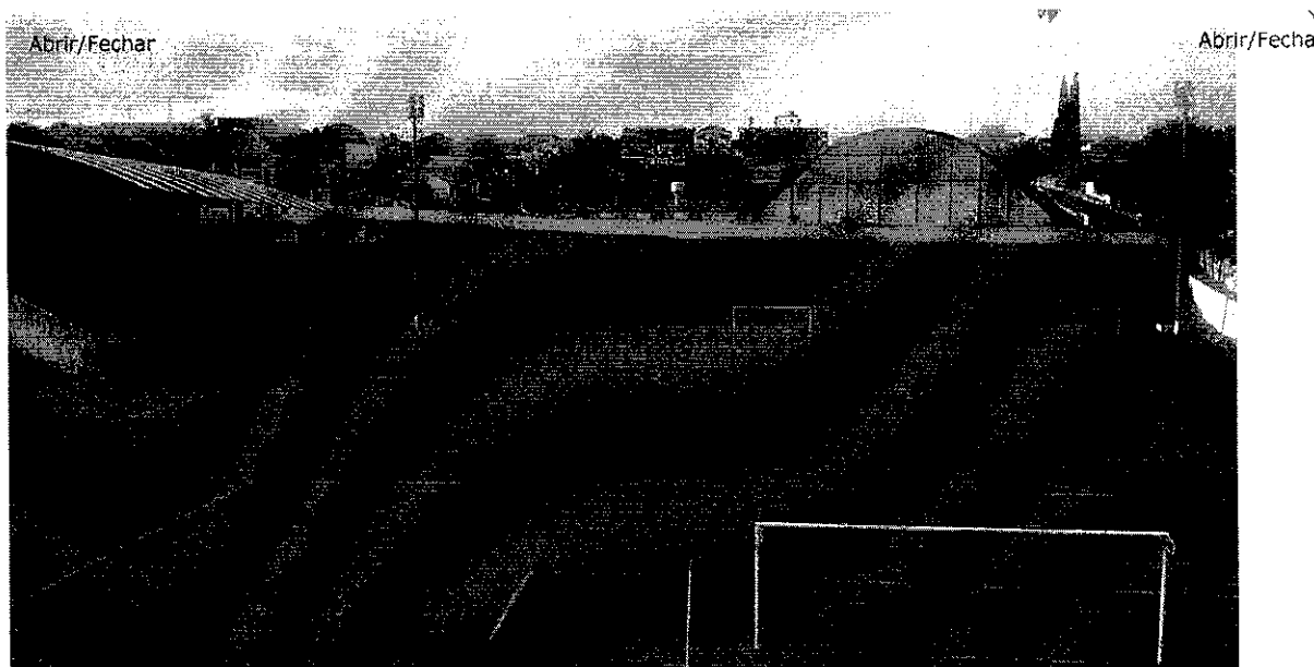
Estádio Nestor de Barros - Palco dos Jogos de Abertura, Semi Finais e Finais - Pompéia - SP.