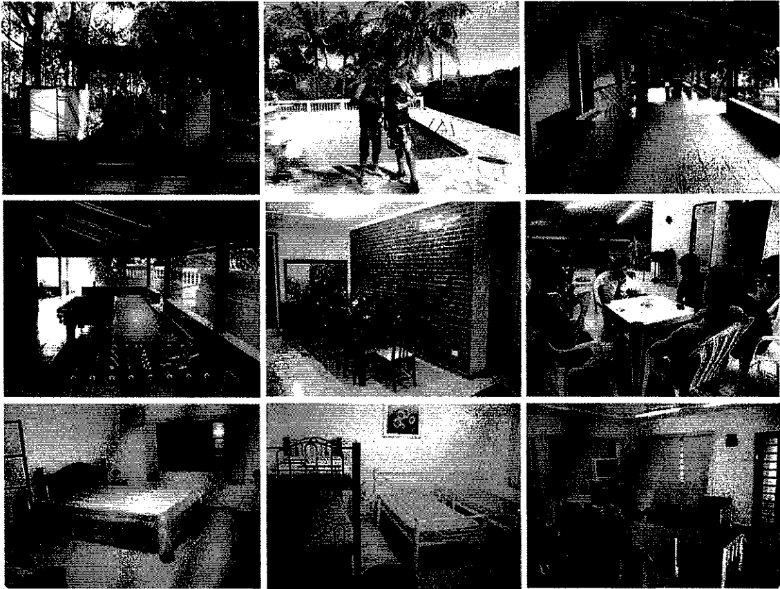
Hospedagem da equipe Metalurgico EC (Força Sindical) Guarulhos - 19 a 24 Janeiro 2014