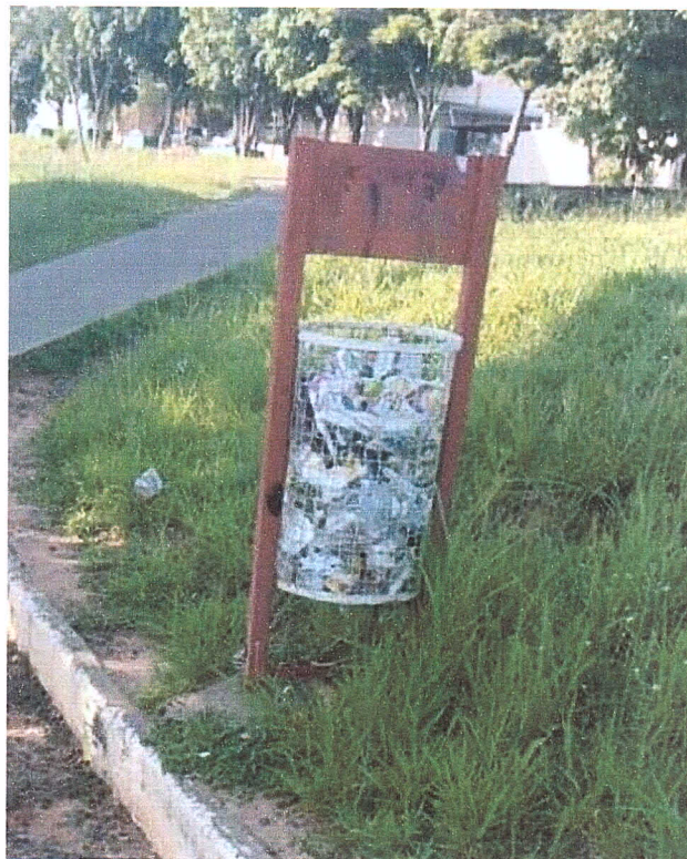
Ciclovía do Trabalhador Dante Muciate